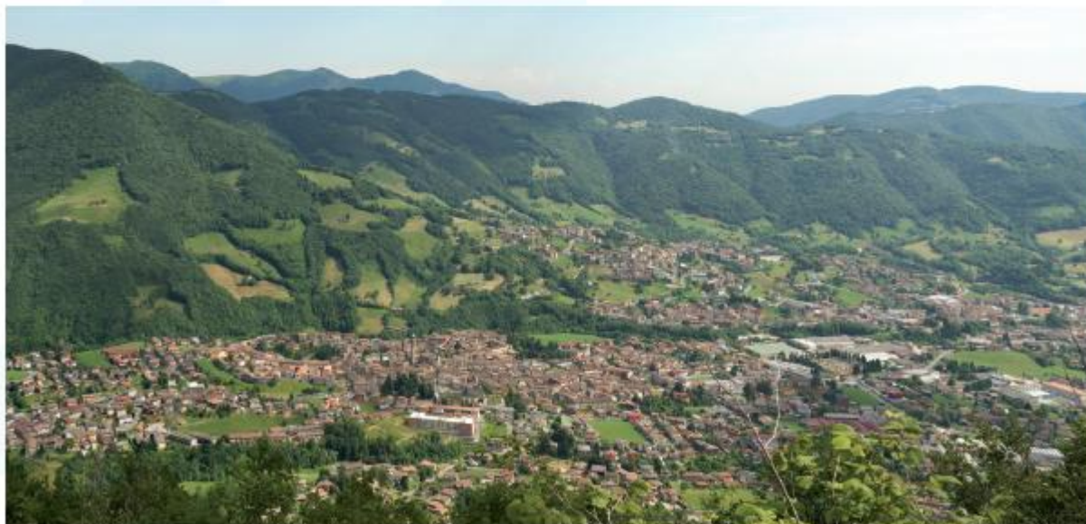
Panorama della Val Gandino