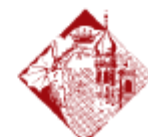
Pro Loco Gandino