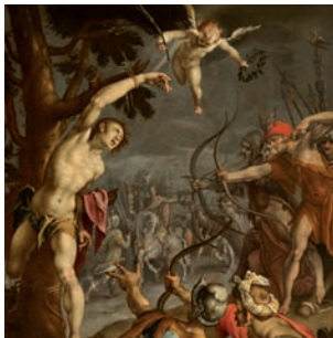
Carlo Ceresa Martirio di San Sebastiano Averara, Chiesa S. Giacomo Maggiore Apostolo