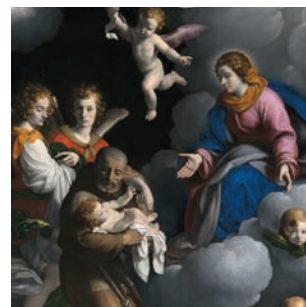
Carlo Ceresa Visione di san Felice da Cantalice con il donatore Nese , Chiesa S. Giorgio

Nel corso del Seicento la città e il territorio di Bergamo accolgono presenze barocche. Opere di pittori milanesi, liguri, veneti, emiliani e toscani, segnate dalla cultura figurativa del tempo. A questa ondata barocca Ceresa oppone un linguaggio semplice, severo, anti-retorico.