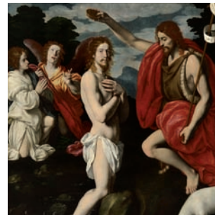
Carlo Ceresa Battesimo di Cristo Terno d'Isola, Chiesa S. Vittore

Gli inizi di Ceresa ritrattista sono brucianti: si manifesta subito come un pittore abile nel ritratto naturale, alieno dagli artifici barocchi. Il confronto con le testimonianze del Maestro del 1633 serve a chiarire le qualità del suo esordio.