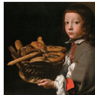
Evaristo Baschenis Ritratto di ragazzo con canestra di dolciumi Collezione privata

L'affermazione di Ceresa come pittore di ritratti è testimoniata dal numero e dalla classe sociale dei suoi committenti. Oltre alle principali personalità del mondo di provincia da cui proviene, il pittore immortala alcuni membri della nobiltà cittadina, dai Vertova ai Pesenti ai Secco Suardo.