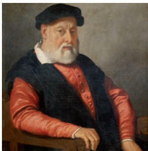
Giovan Battista Moroni Ritratto di vecchio Bergamo, Accademia Carrara

Nelle opere giovanili il pittore si rifà a modelli incisori della tarda maniera italiana e del manierismo internazionale. Il confronto calzante tra stampe e dipinti rende chiaro il processo di formazione del pittore.