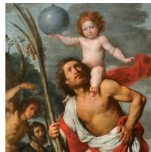
Bernardo Strozzi San Cristoforo che traghetta il Bambino e i Santi Sebastiano e Rocco. Almenno San Salvatore, Chiesa prepositurale del SS. Salvatore.