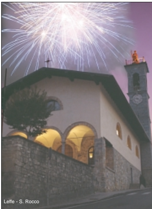
Leffe - S. Rocco