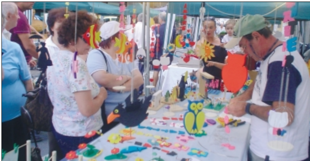
Leffe - Impara l'arte