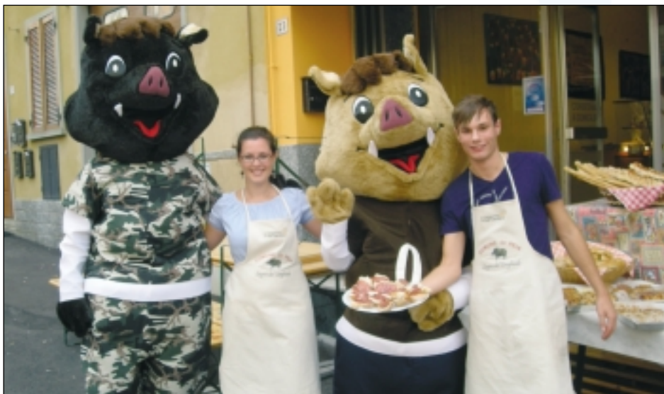
Peia - Sagra del cinghiale