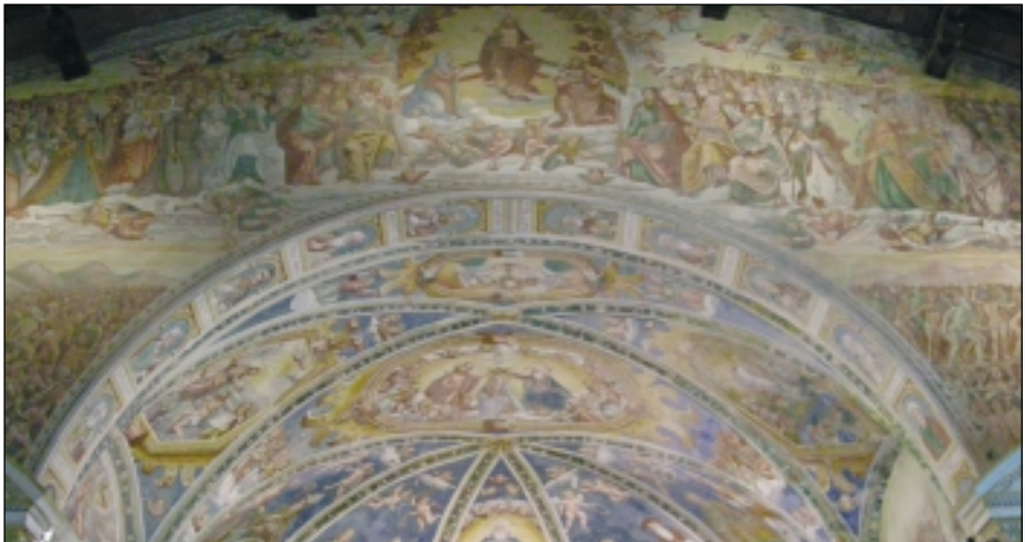
Casnigo - Santuario Ss. Trinità