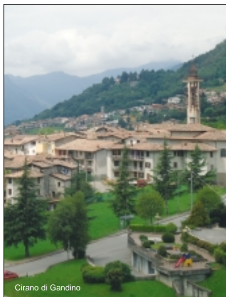
Cirano di Gandino