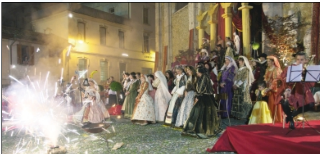
Gandino - In Secula